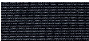
Operadlo - KM-41 čierny mesh