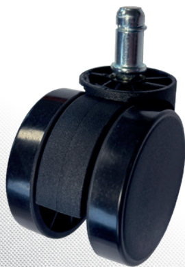
Vysokozáťažové koliesko NATUS 180 na zvýšenie nosnosti na 180 kg. Potrebne dokúpiť samostatne.